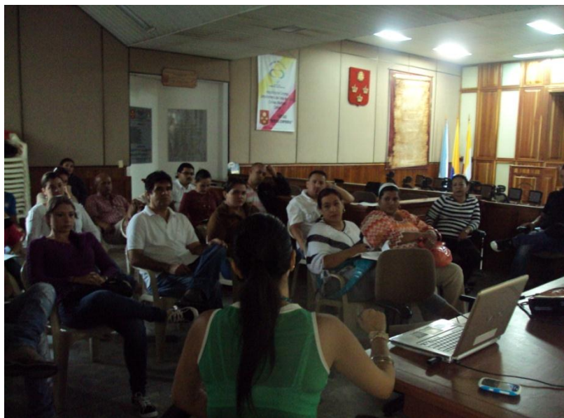
INDUCCION A SERVIDORES PUBLICOS QUE APOYARON EL PROGRAMA