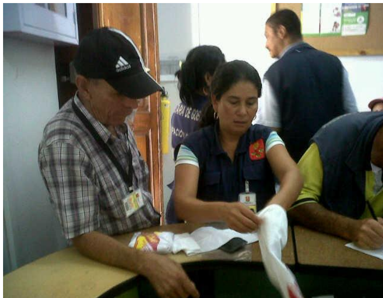
ENTREGA ELEMENTOS DE PROTECCION