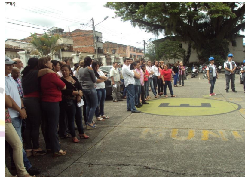
SIMULACRO DE SISMO NACIONAL