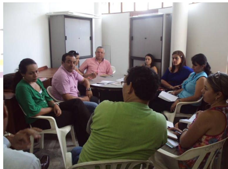
SENSIBILIZACION AL COMITÉ DE CONVIVENCIA LABORAL