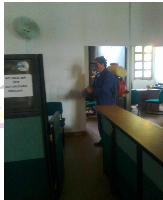
JORNADAS DE FUMIGACIÓN