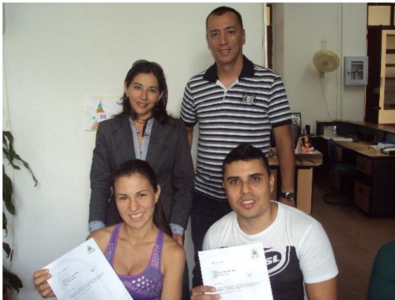
ENTREGA SUBSIDIO DE VIVIENDA