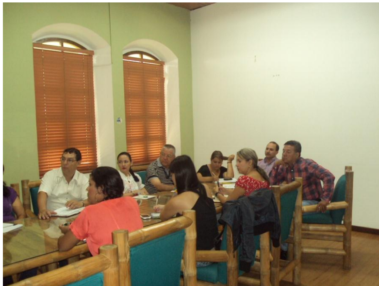
CAPACITACION AL COMITÉ DE CONVIVENCIA LABORAL