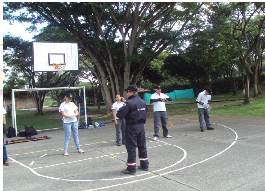
ENTRENAMIENTO BRIGADA DE EMERGENCIA