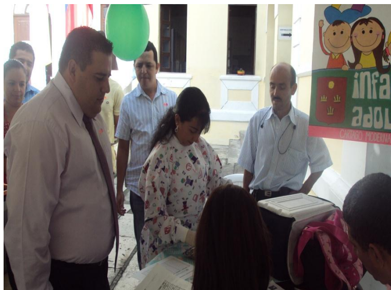
JORNADA DE VACUNACIÓN