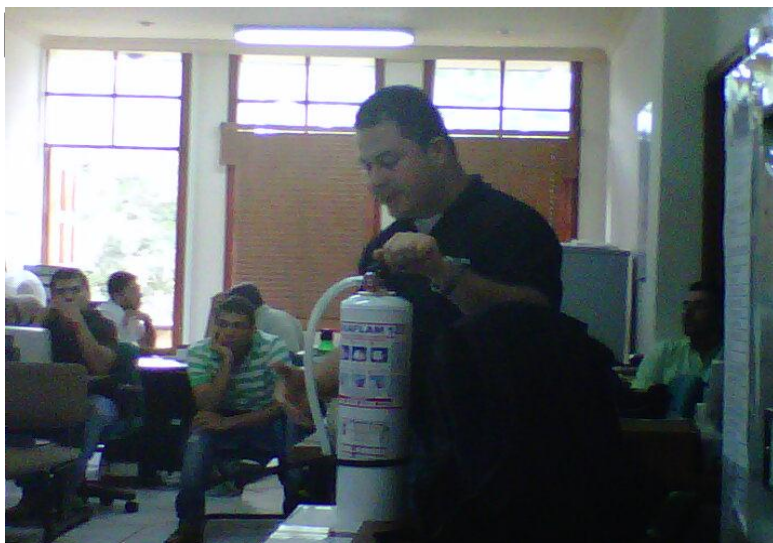
CAPACITACIÓN MANEJO DE EXTINTORES