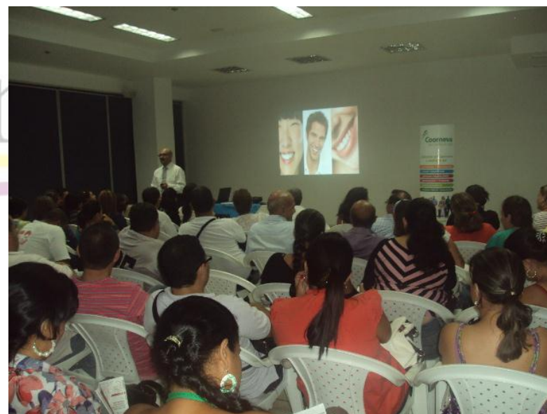
CONFERENCIA SENTIDO DE PERTENENCIA