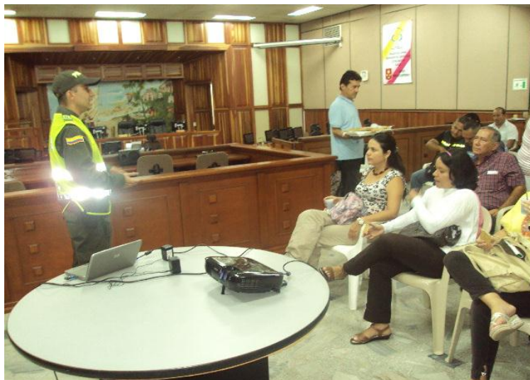
TALLER MANEJO DE LA COMUNICACION