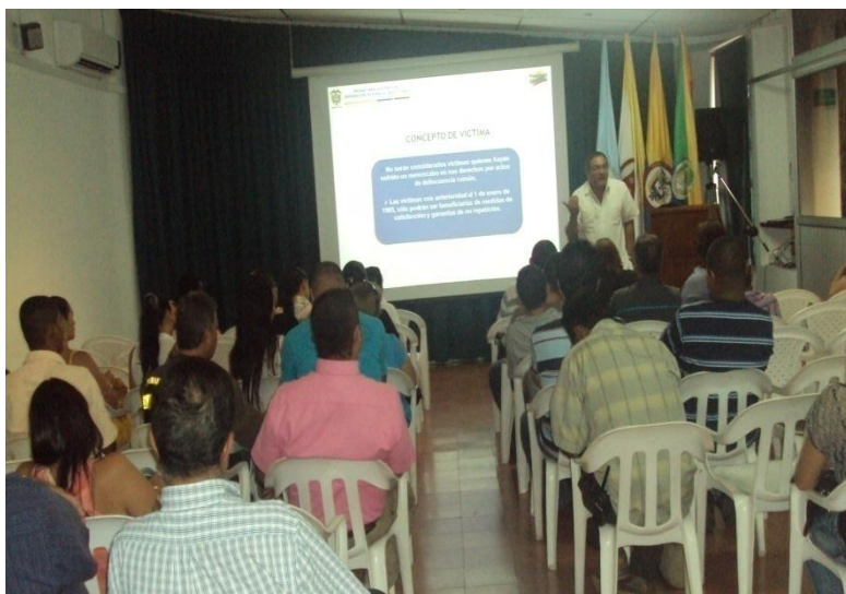
LEY DE VICTIMAS