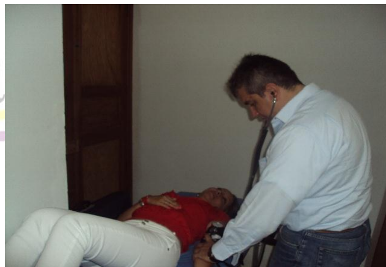
VALORACION MEDICO OCUPACIONAL