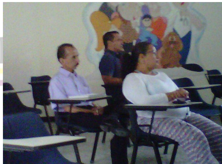
CONFERENCIA VIRUS DEL PAPILOMA HUMANO