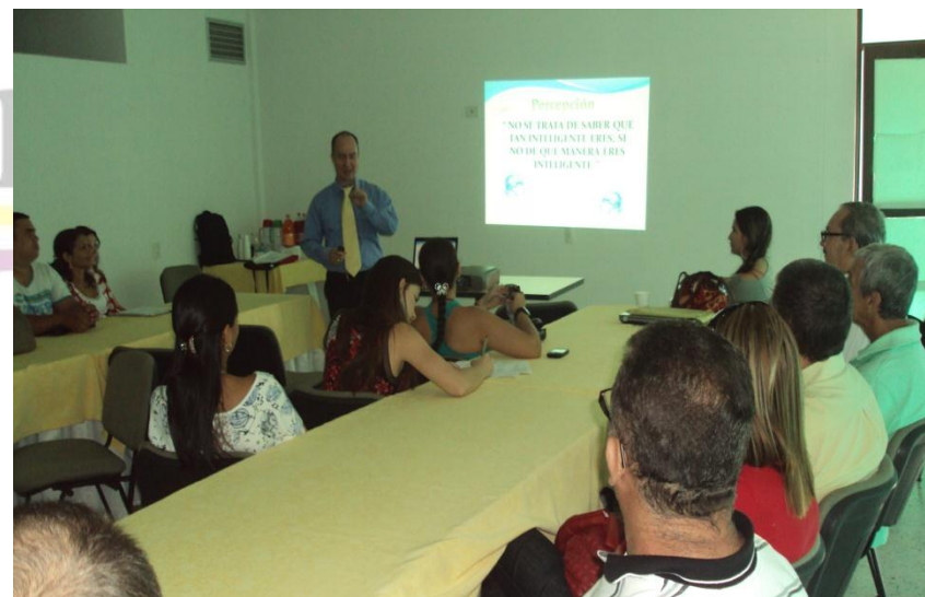
CONFERENCIA SANA CONVIVENCIA