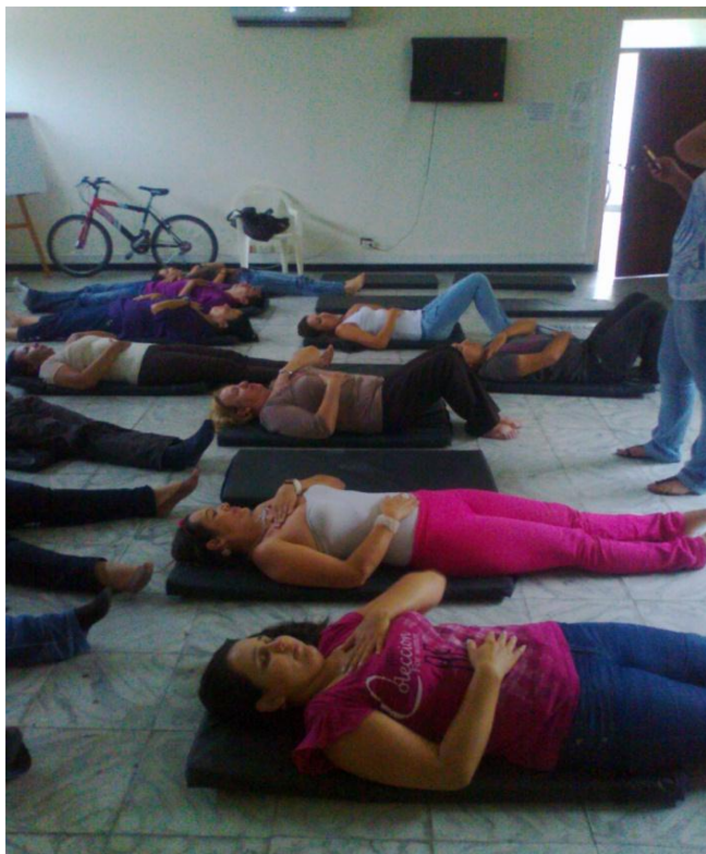
TERAPIA DE RELAJACIÓN