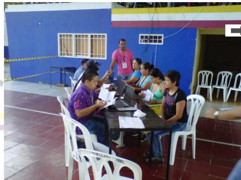
ATENCION A FAMILIAS