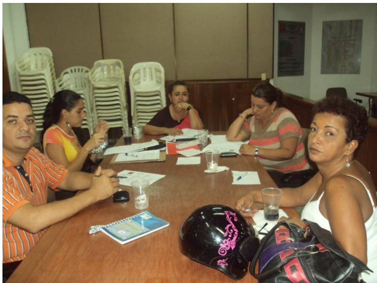
REUNIONES DEL COPASO