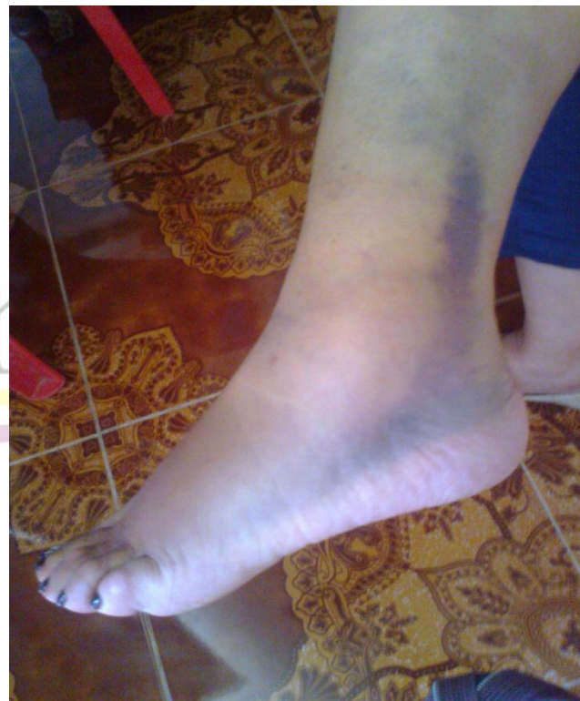
INVESTIGACIÓN ACCIDENTES LABORALES