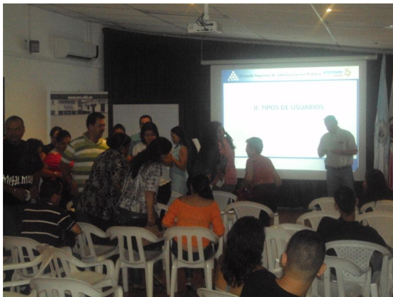
ATENCIÓN AL CIUDADANO