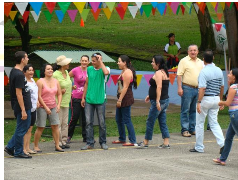
MARATON DE LA DIVERSION