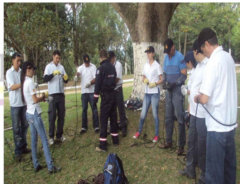
ACTIVIDADES DE LA BRIGADA DE EMERGENCIA