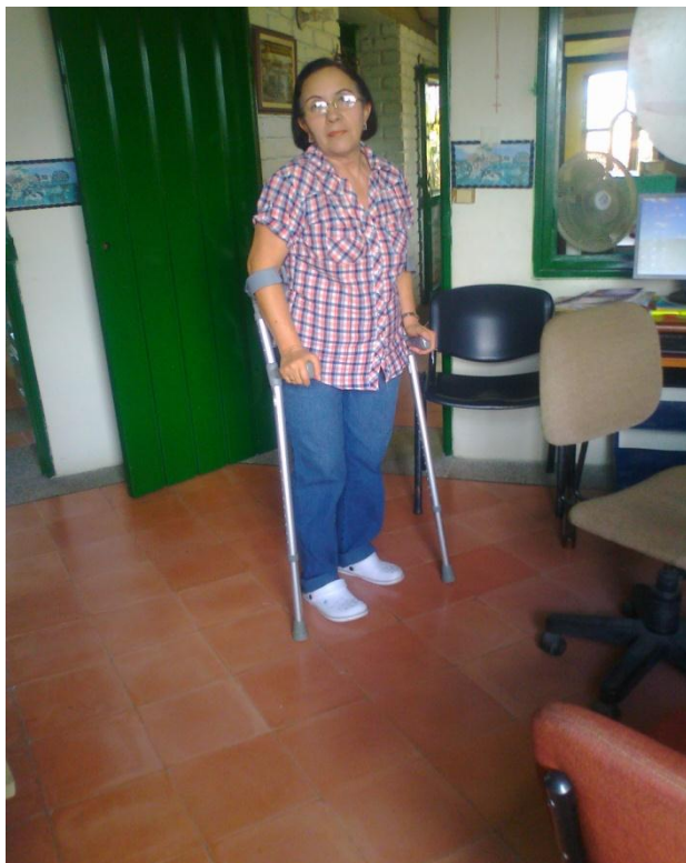
INSPECCION PUESTOS DE TRABAJO