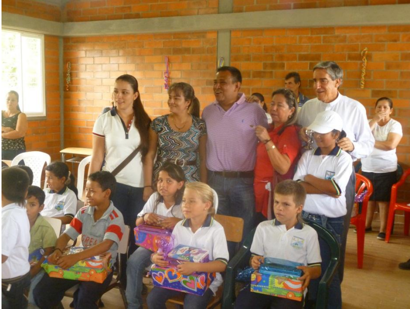
DOTACION A ESTUDIANTES