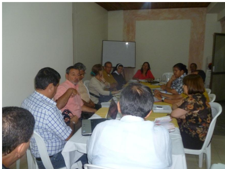
Trabajo en Equipo