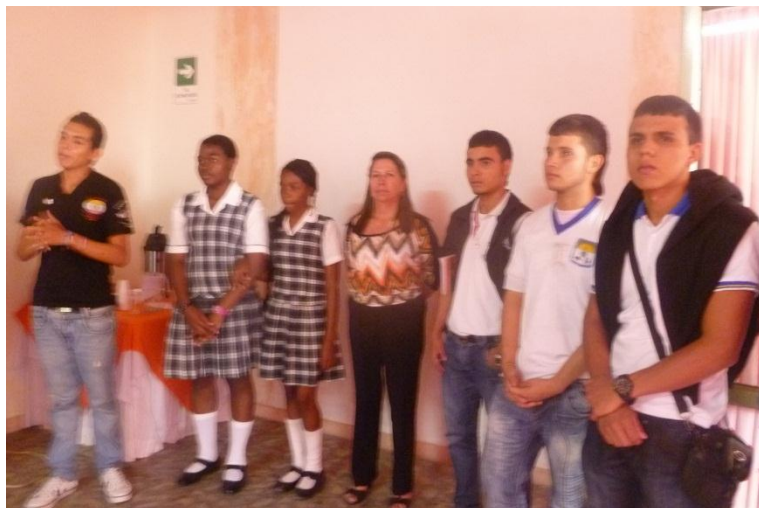
PERSONEROS EN ACCION