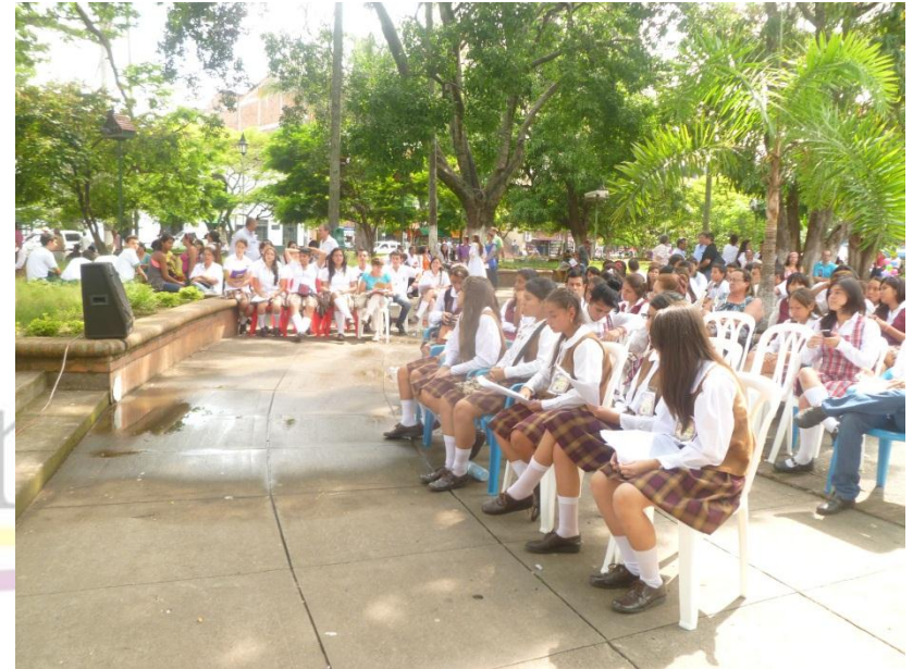
ESPACIOS CULTURALES ACTIVOS