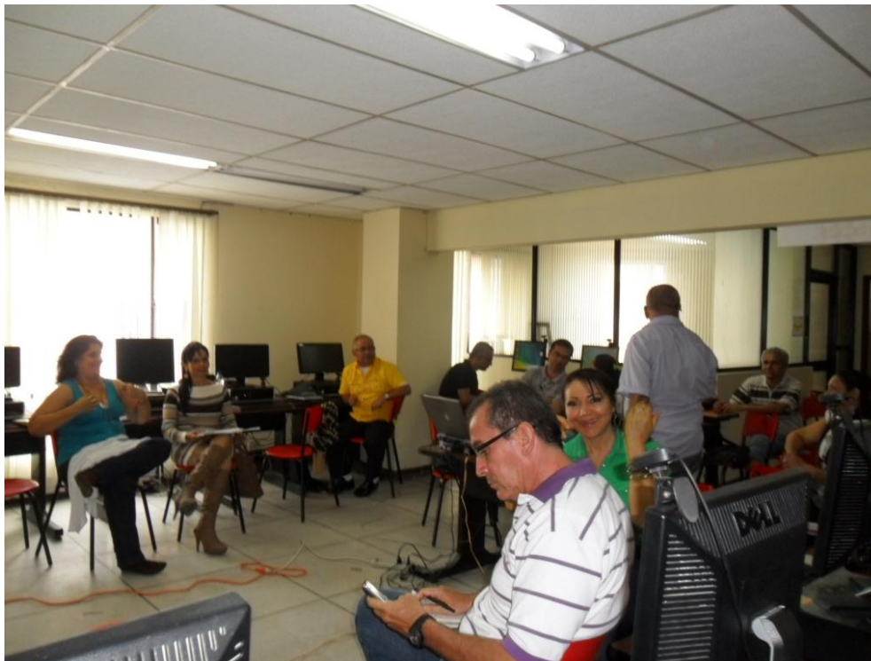
Evidencia capacitación temáticas