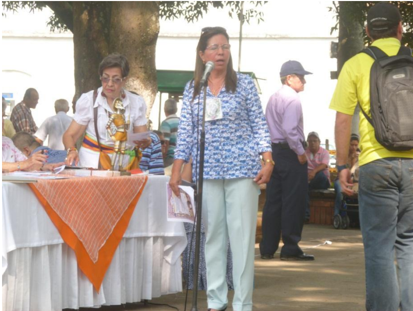
PROGRAMAS DE CULTURA