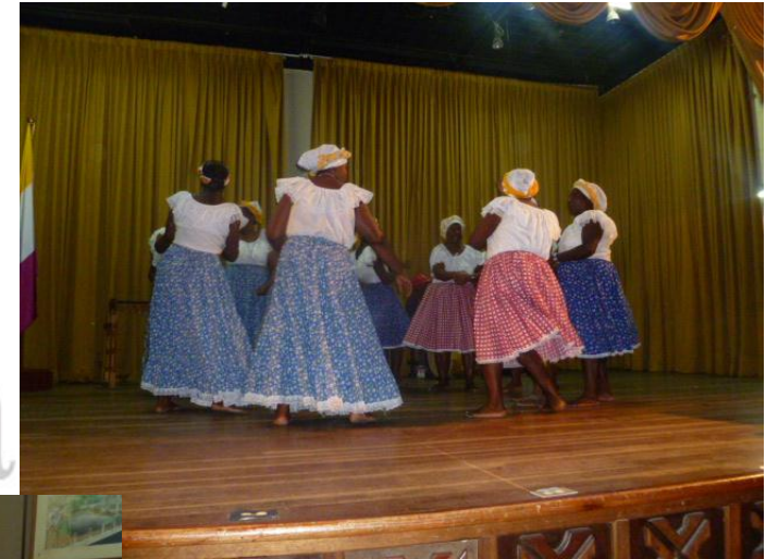
PERSONEROS EN ACCION