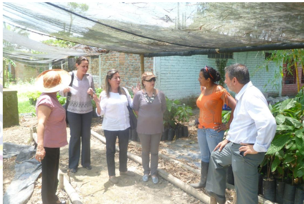
VISITAS DE ASESORIA