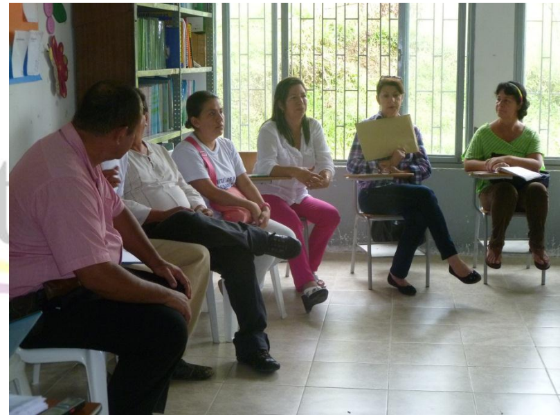
Apoyo a Rectores