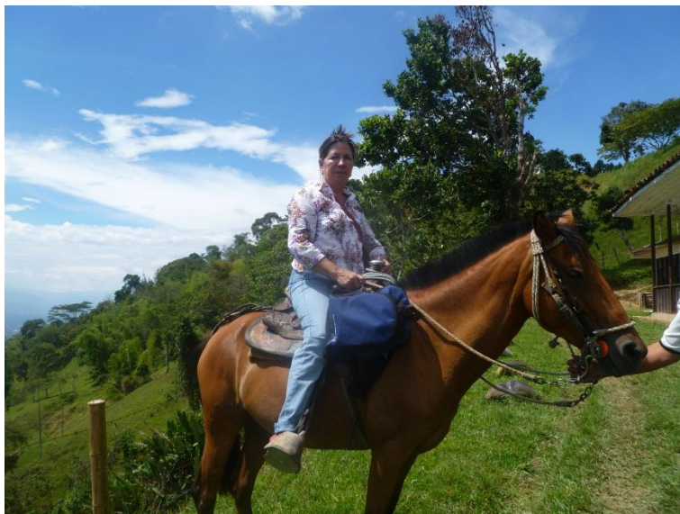
DESAFIANDO EL PELIGRO