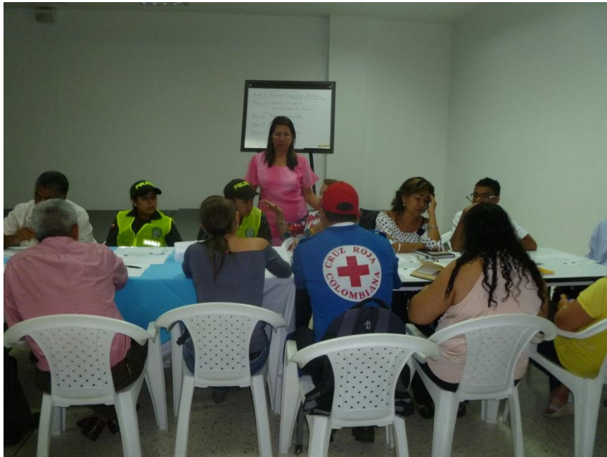
Programas de Infancia y Adolescencia