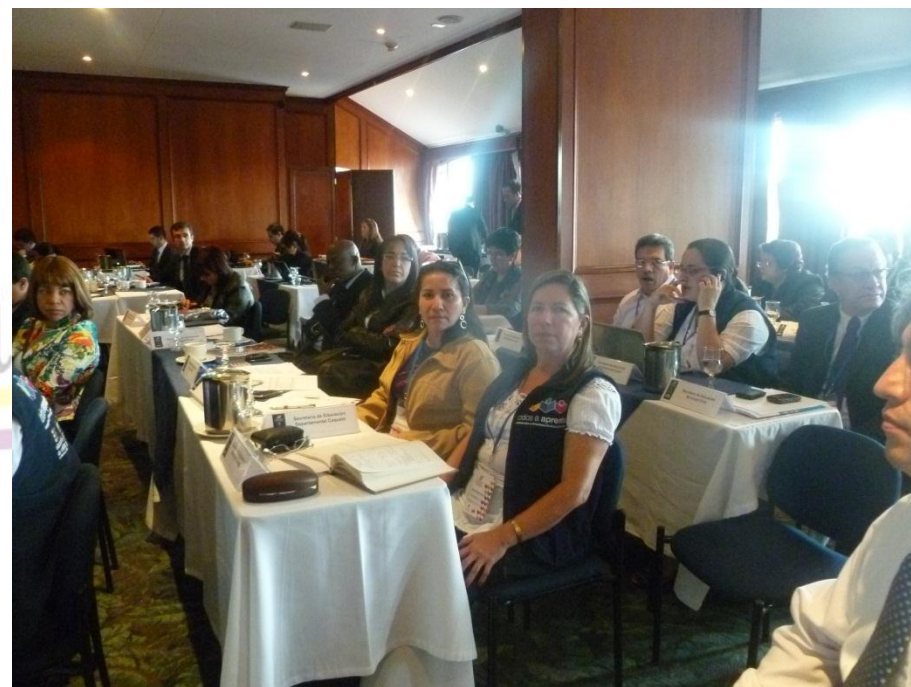
GESTION CON EL MINISTERIO