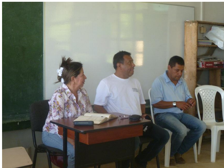
APOYO A COMUNIDADES